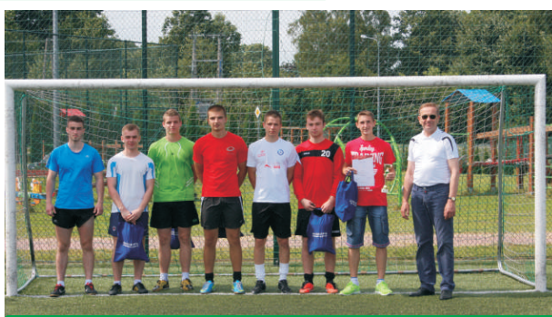
III MIEJSCE ZAJĘŁA DRUŻYNA Z TERESPOLA - AMARENA