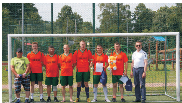
II MIEJSCE ZAJĘŁA DRUŻYNA Z KOROSZCZYNA