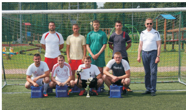
I MIEJSCE ZAJĘŁA DRUŻYNA Z MAŁASZEWICZ