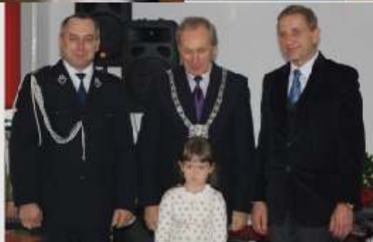
Moment wręczenia nagród dla laureatów w I grupie wiekowej.