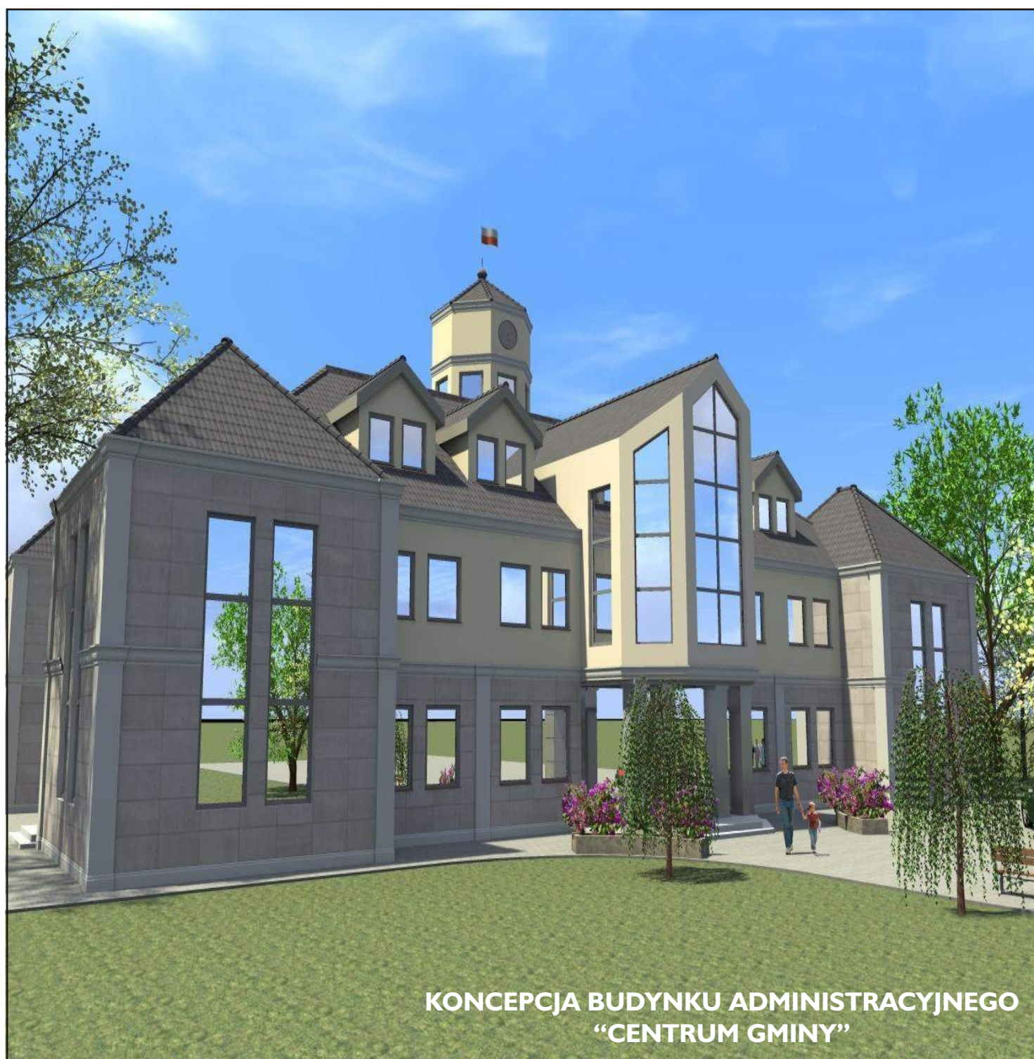
KONCEPCJA BUDYNKU ADMINISTRACYJNEGO "CENTRUM GMINY"

tel. (083) 376 12 20 fax. (083) 376 12 29 e-mail: info@terespol.ug.gov.pl