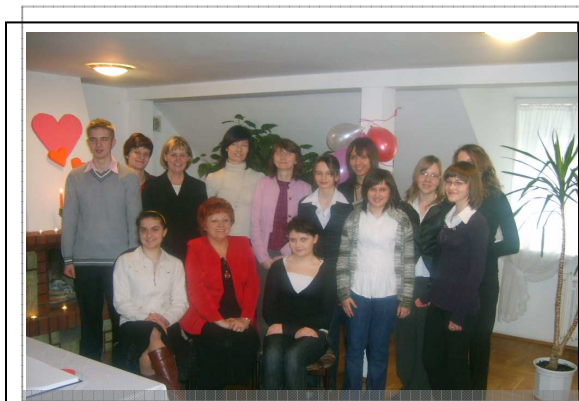
Uczestnicy konkursu wraz z jury