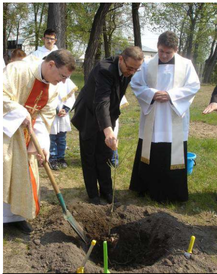
Akt sadzenia Dębu ku czci kard. Stefana Wyszyńskiego