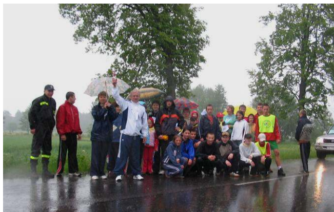
Przekazanie szarfy gminie Rokitno