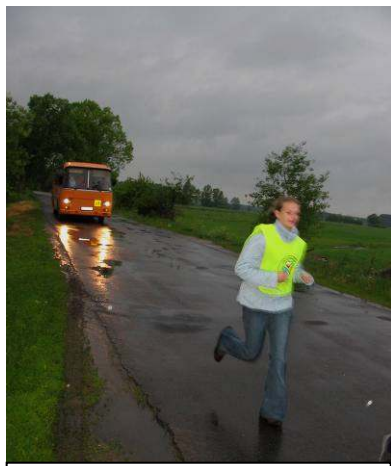
I etap : Dobratycze-Terespol

W dniu 31 maja 2006r do gminy Terespol przybyła ogólnopolska sztafeta Kwietny Bieg. Przedsięwzięcie to upamiętnia Pierwszą Pielgrzymkę Jana Pawła II do Polski, jest hołdem i wyrazem szacunku dla dzieła Naszego Wielkiego Rodaka , Jego wkładu na rzecz wzmacniania wspólnoty Polaków i pracy nad odzyskaniem Niepodległości.