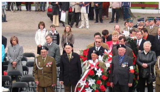
Delegacja Miejsko Gminnego Koła Kombatantów oraz Stowarzyszenia Kombatantów Armii Krajowej „Polesie” z Brześcia