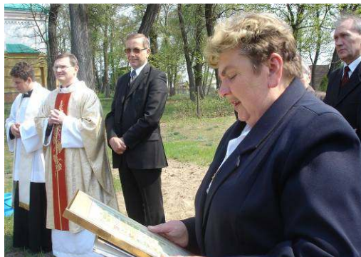
Akt sadzenia Dębu ku czci kard. Stefana Wyszyńskiego

prowadzi. Ty nieustannie powołujesz i posyłasz zwiastunów swojego Słowa, aby ta mądrość znalazła mieszkanie na naszej ziemi. Spraw abyśmy upamiętniając przez sadzenie tych dębów imiona Sług Bożych Jana Pawła II i Kardynała Stefana Wyszyńskiego oraz tych, którzy zasłużyli się dla naszej ziemi siedleckiej postępowali w mądrości Bożej szli śladami i tak uwielbili przedwieczną Mądrość” – takimi słowami modlił się Ordynariusz Siedlecki.