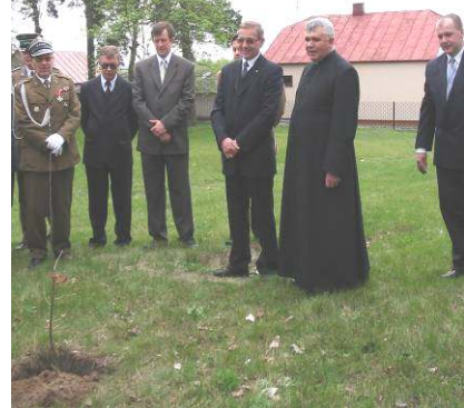
Akt sadzenia Dębu ku czci Jana Pawła II