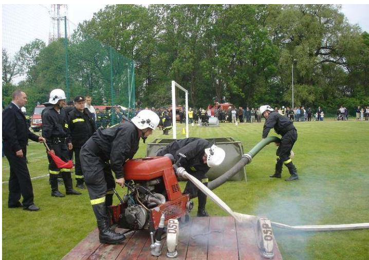
Drużyna OSP Łęgi startuje w bojówce.