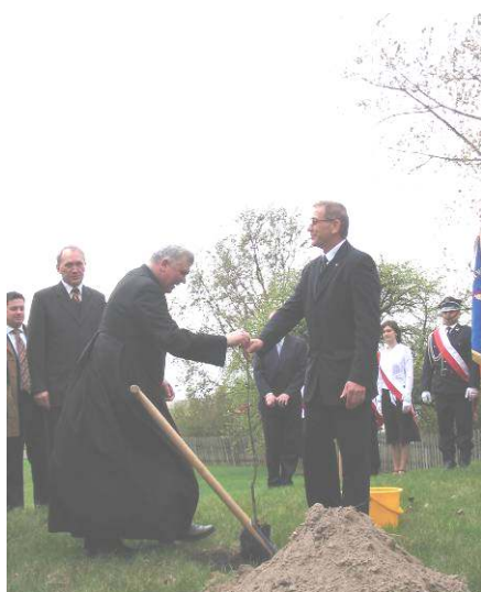
Akt sadzenia „Dębu Papieskiego”