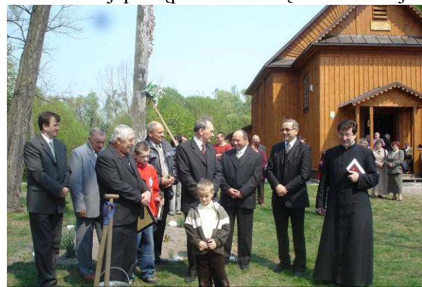
Akt sadzenia Dębu ku czci bł. Wincentego Lewoniuka