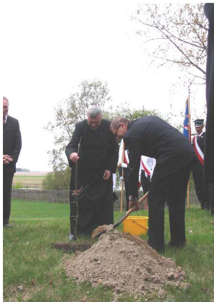
Akt sadzenia Dębu ku czci Jana Pawła II

W gminie Terespol dąb Ojca Świętego Jana Pawła II został posadzony podczas uroczystości z okazji 3 maja przy Pomniku Niepodległości w Koroszczynie. Kolejne dęby zostały posadzone 7 maja. Dąb ku czci Kardynała Stefana Wyszyńskiego został posadzony przy kaplicy parafialnej w Kobylanach, natomiast trzeci dąb ku czci błogosławionego Wincentego Lewoniuka, męczennika unickiego, urodzonego w Krzyczewie został posadzony przy kościele pw.