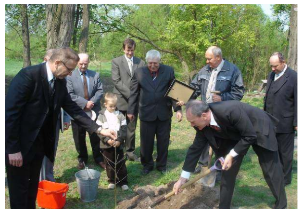
Akt sadzenia Dębu ku czci bł. Wincentego Lewoniuka