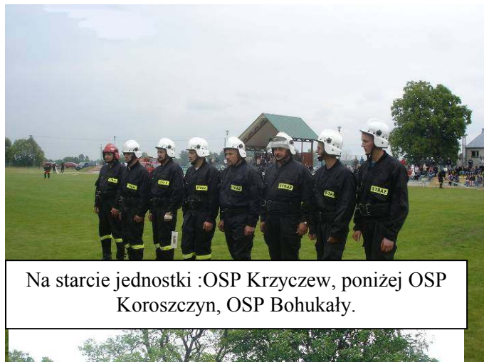
Na starcie jednostki :OSP Krzyczew, poniżej OSP Koroszczyn, OSP Bohukały.

W trakcie zmagania reprezentanci gminy Terespol uzyskali następujące wyniki: