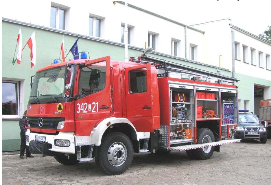
Nowy wóz strażacki PSP z Małaszewicz

Systematyczny wzrost przewożonych koleją towarów, w tym materiałów niebezpiecznych przez polsko-białoruskie przejście graniczne Terespol-Brześć, uświadomił konieczność wzmocnienia technicznego zaplecza Jednostki. W ramach czynności zmierzających do zabezpieczenia towarów oraz