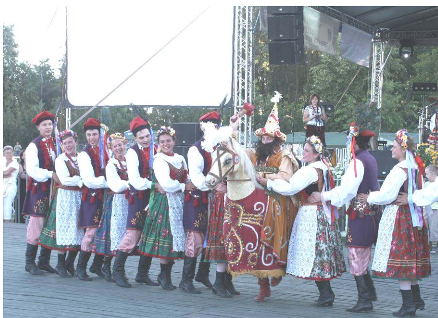
Zespół „Biawena” z Białej Podlaskiej

W ramach projektu „Kultura bez granic” została przewidziana również dwudniowa polsko-białoruska konferencja „Perspektywy rozwoju współpracy