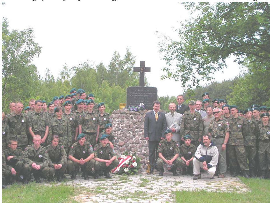
Uczestnicy Marszu z przedstawicielami władz samorządowych przy Pomniku w Kobylanach

Pamiętkową Tablicą i pod Pomnikiem Legionistów w Konstantynowie, pod Pomnikiem Legionistów w Janowie Podlaskim oraz pod Pomnikiem Niepodległości w Koroszczyń. Uroczyste rozwiązanie Marszu nastąpiło pod Pomnikiem ku czci poległych w Bitwie pod Kobylanami.