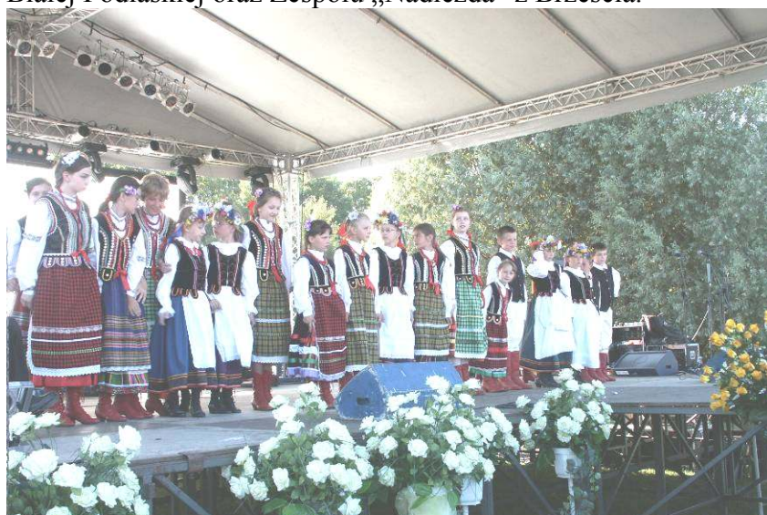
Gminny Zespół Tańca Ludowego „Obertas”

W ramach Przeglądu Folklorystycznego na scenie wystąpiły zespoły muzyczne z Polski i Białorusi. Dużym zainteresowaniem publiczności cieszyły się występy zespołów tańca ludowego „Biawena” z Białej Podlaskiej oraz Zespołu „Nadieżda” z Brześcia.