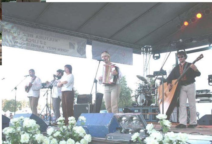
Zespół „Czeremszyzna” z Czeremchy

terenie łowiska firmy „EKO-BUG”, w ramach którego zorganizowano zawody sportowe o Puchar Wójta Gminy Terespol. W zawodach strzeleckich uczestniczyło 27 osób, strzelano do tarczy z karabinków sportowych małokalibrowych. W rozgrywkach w piłkę plażową wzięło udział 5 trzyosobowych drużyn, zaś do zawodów wędkarskich w kategorii junior zgłosiło się 15 osób, a w kategorii seniorzy 25