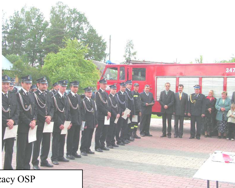
Odznaczeni i wyróżnieni strażacy OSP