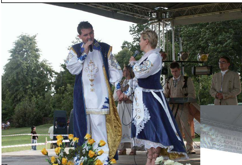
Zespół „Prymaki” z Gródka

terenie łowiska firmy „EKO-BUG”, w ramach którego zorganizowano zawody sportowe o Puchar Wójta Gminy Terespol. W zawodach strzeleckich uczestniczyło 27 osób, strzelano do tarczy z karabinków sportowych małokalibrowych. W rozgrywkach w piłkę plażową wzięło udział 5 trzyosobowych drużyn, zaś do zawodów wędkarskich w kategorii junior zgłosiło się 15 osób, a w kategorii seniorzy 25