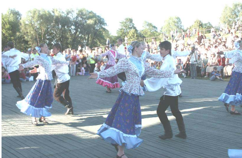
Zespół "Nadzieńda" z Brześcia na Białorusi