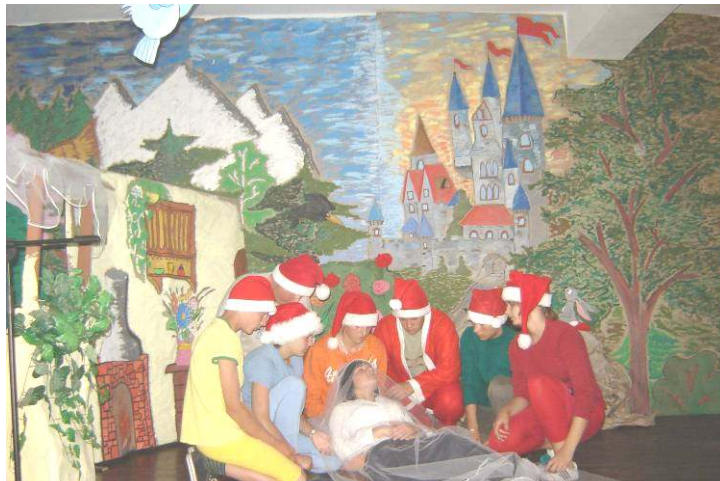
Inscenizacja bajki „Królewna Śnieżka”.