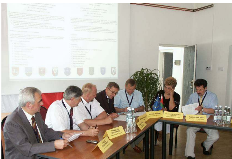
Podpisanie porozumienia w GOK w Koroszczynie

Owoce konferencji było także zawarcie polsko-białoruskiego porozumienia, dotyczącego wspólnego aktywnego promowania idei spotkań na polsko-białoruskim Pograniczu pod nazwą „Kultura bez granic”, które mają przyczynić się tym samym do rozszerzania i