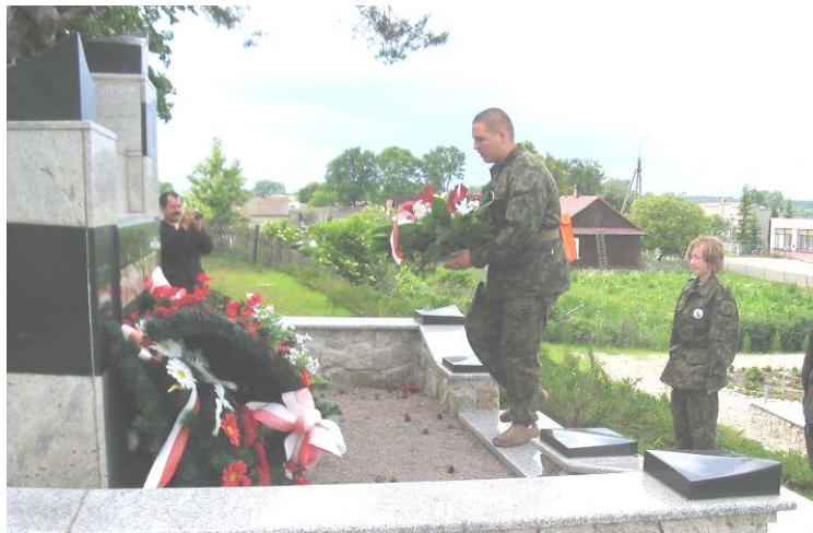
Złożenie kwiatów pod Pomnikiem Niepodległości w Koroszczyń

Program XI Marszu obejmował między innymi złożenie wiązanek kwiatów w 5 miejscach na terenie Powiatu Bialskiego, związanych z Legionami Marszałka Józefa Piłsudskiego. Młodzież złożyła kwiaty pod