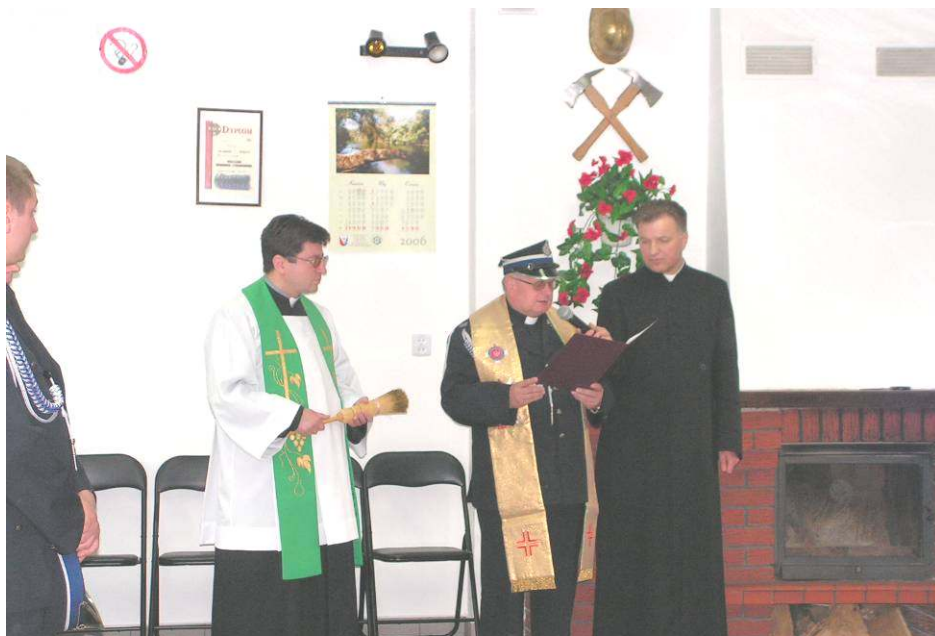
Poświęcenie odremontowanej remizo- świetlicy