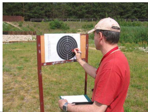
Liczenie punktów podczas zawodów na Strzelnicy

Zasadniczym celem imprezy było kształtowanie tradycji i rozszerzenie współpracy w wymiarze transgranicznym na bazie podpisanego w 2002 r. Porozumienia między miastem Brześć i