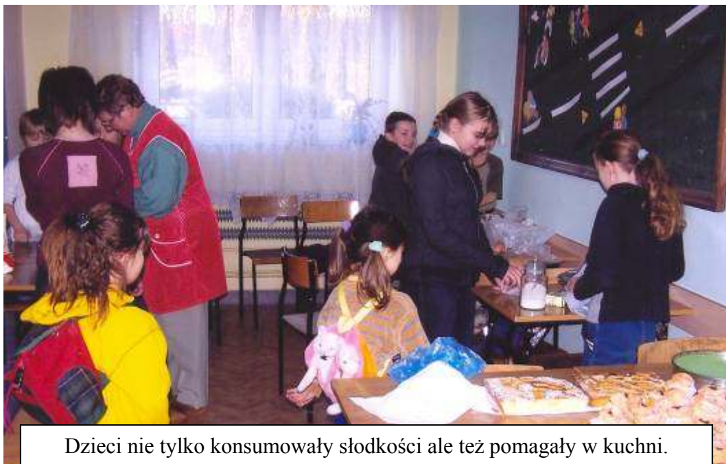
Dzieci nie tylko konsumowały słodkości ale też pomagały w kuchni.