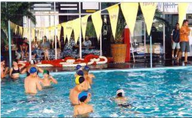
Na basenie w Białej Podlaskiej.