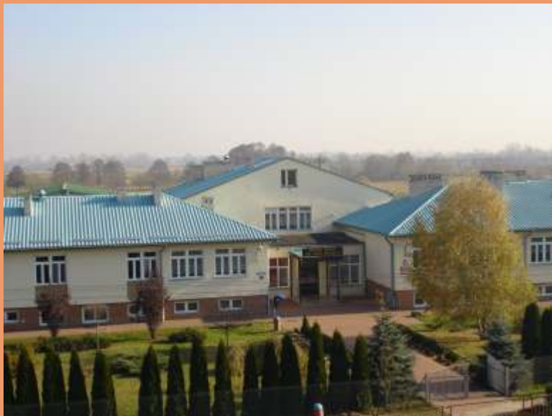
Zespół Szkół im. Orła Białego w Kobylanach.