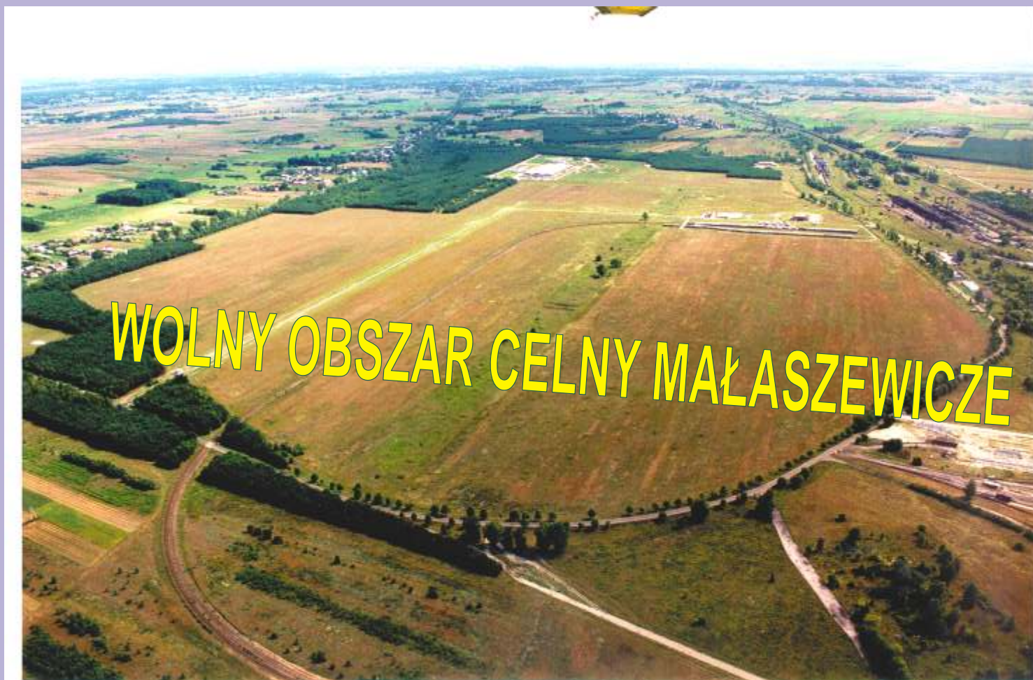
Fot. WOC z lotu ptaka

Na terenie Wolnego Obszaru Celnego Małaszewicze działają firmy m.in.: Zakłady Mięsne "Dolina Łęka", terminal przeładunkowy gazu holendersko - polskiej firmy "Gaspol" i kilka innych. Obecnie tych firm oznacza nowe miejsca pracy na terenie gminy.