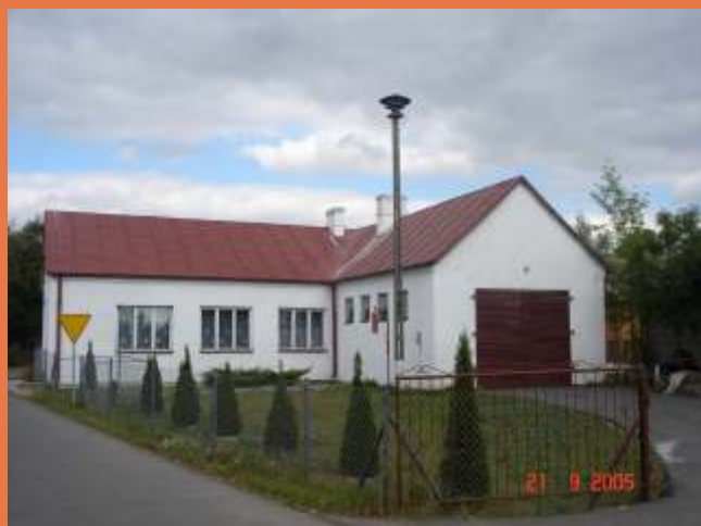
Remiza i Dom Strażaka w Łęgach