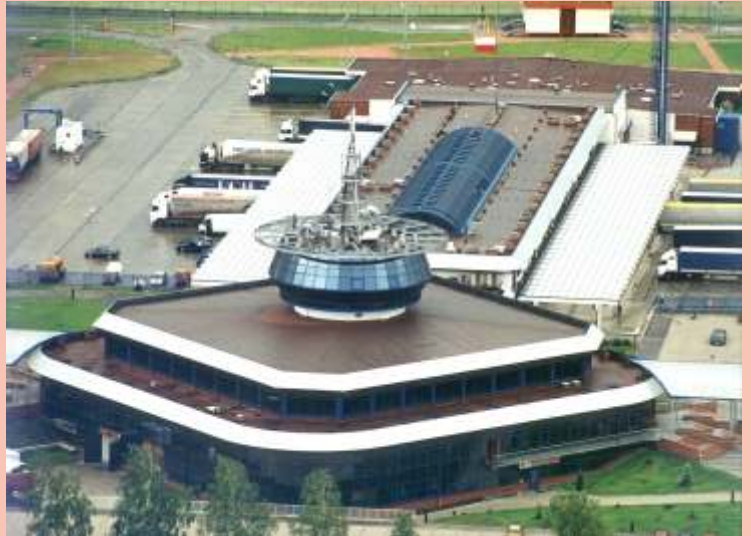
Terminal Samochodowy w Koroszczynie.

Terminal został zlokalizowany w odległości 5 km od przejścia granicznego Kukuryki - Kozłowice. Z granicą sąsiaduje go droga celna, trwale oddzielona od ruchu lokalnego i przez całą dobę monitorowana.