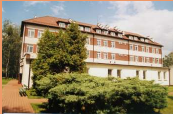
ZESPÓŁ SZKÓŁ im. Wł. S. Reymonta w Małaszewiczach

Warto też podkreślić, że gmina utrzymuje Przedszkole Publiczne w Małaszewiczach.