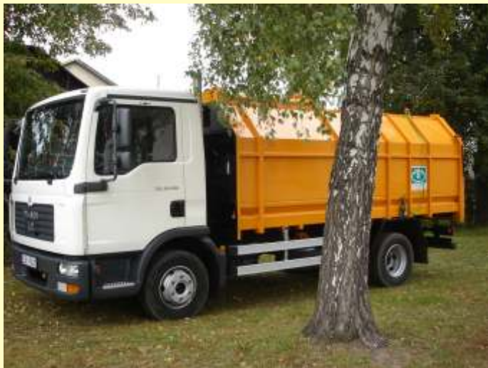
Nowy samochód do wywozu nieczystości stałych.