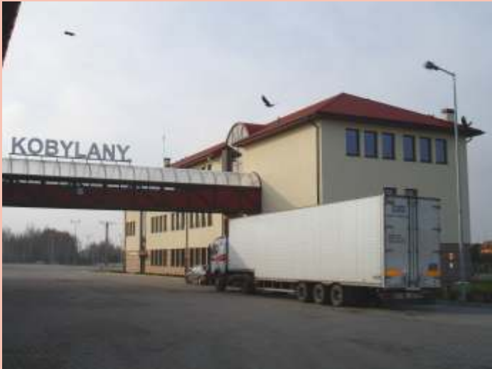
Terminal w Kobylanach

Gmina Terespol po wstąpieniu Polski do Unii Europejskiej stała się jezdnią trznią granicą. Ruch graniczny odbywa się przez 3 przejścia graniczne zlokalizowane na terenie gminy: - w Koroszczynie Kukurykach dla TIR; - w Terespolu (przejście „Warszawski Most”) dla samochodów osobowych i autobusów; - przejście kolejowe (Małaszewicze - Terespol).