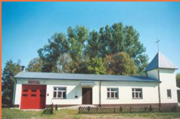
Remiza w Koroszczynie siodująca z kaplicą parafialną

W gminie Terespol system ratownictwa tworzy 6 jednostek OSP w : Neplach, Bohukałach, Krzyczewie, Koroszczynie, Łęgach, Murawcu. Ponadto w Małaszewiczach funkcjonuje jednostka specjalistyczna Państwowej Straży Pożarnej wchodząca w skład Krajowego Systemu Ratowniczo - Gaśniczego.