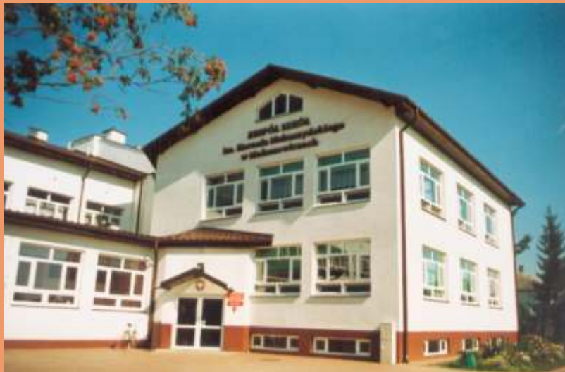
Zespół Szkół im. Kornela Makuszyńskiego w Małaszewiczach.