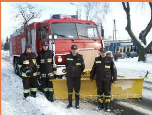
Strażacy z OSP Neple podczas akcji odśnieżania dróg

Wykonano również remonty w remizach wietlicach.