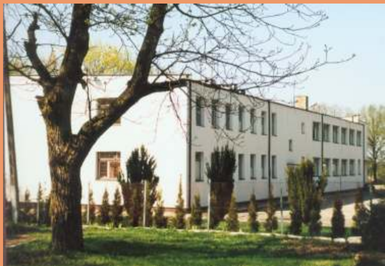
Szkoła Podstawowa im. Juliana Ursyn Niemcewicza w Neplach.

Równocześnie - do likwidacji infrastrukturalnych zapór nie cywilizacyjnych - priorytetem w działaniach władz gminy Terespol była oświata, szczególnie po przejściu przez gminę szkół podstawowych.