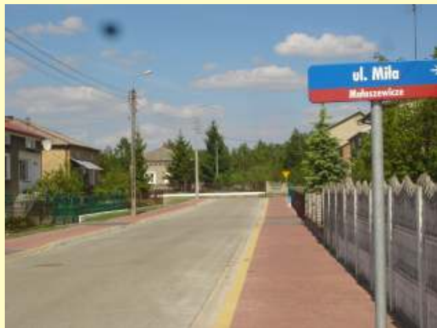
Jedna z nowowytbudowanych ulic w Małaszewiczach

wiadczeniem usług komunalnych na terenie gminy zajmuje się Spółka EKO - BUG. Jest to jednoosobowa spółka z ograniczoną odpowiedzialnością gminy Terespol, która została zarejestrowana 29 maja 1998 roku. Jest to pierwsza spółka komunalna w gminie.