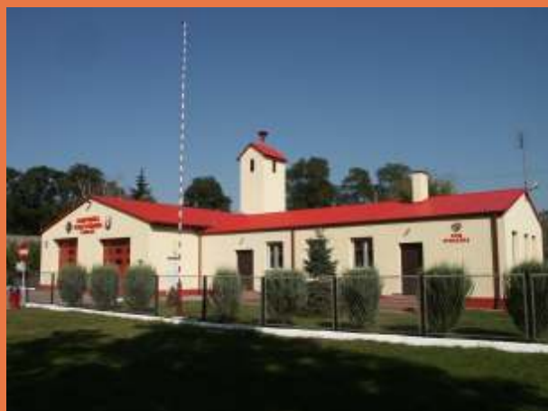
Remiza i Dom Strażaka w Neplach