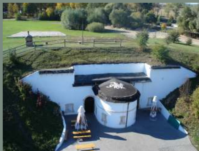
Bar “Prochownia” w Kobylanach.

Hotel dysponuje 18 miejscami noclegowymi w 1 i 2 osobowych pokojach, sala konferencyjna na około 130 osób z zapleczem kuchennym. Hotel ma strzezony parking.