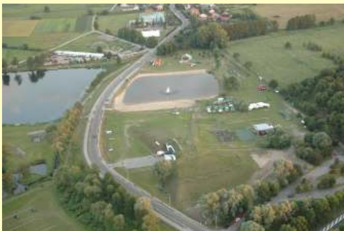
Siedziba Spółki oraz łowisko i kłopotisko w Kobylanach

Z łącznej długości dróg gminnych (95 km) nawierzchnia twarda posiada 40,0 km.