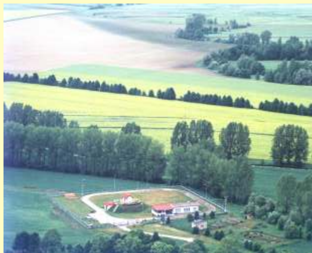
Oczyszczalnia ścieków w Koroszczynie