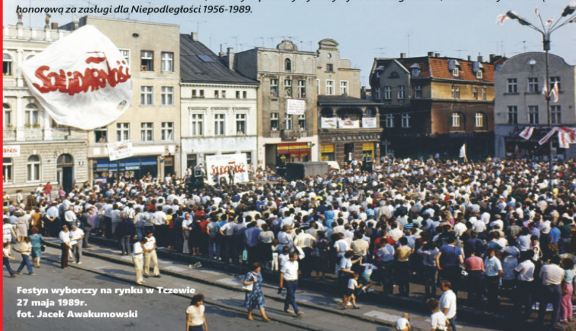
Festyn wyborczy na rynku w Tczewie 27 maja 1989r.