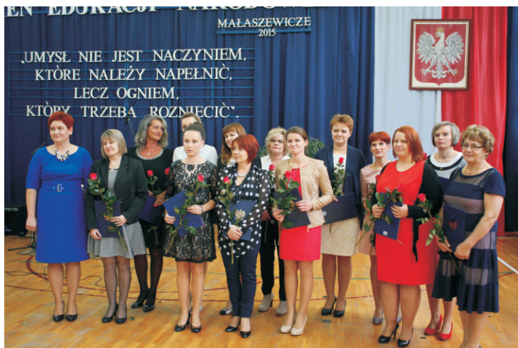
Zespołu Szkół im. K. Makuszyńskiego w Małaszewiczach

– Starosta Bialski. Wójt Gminy oraz Dyrektorzy szkół wręczyli nagrody, które corocznie są przyznawane z okazji święta wyróżniającym się pracownikom. Były piękne bordowe róże, dyplomy i wspólne pamiątkowe zdjęcia. Część artystyczna z udziałem własnego szkolnego zespołu muzycznego zakończyła część oficjalną uroczystości, po której czekał na wszystkich świąteczny poczęstunek.