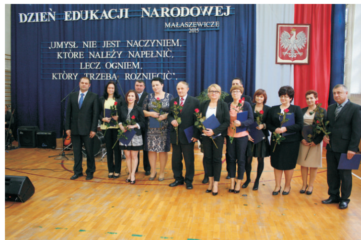
Zespół Szkół im. Władysława Stanisława Reymonta w Małaszewiczach