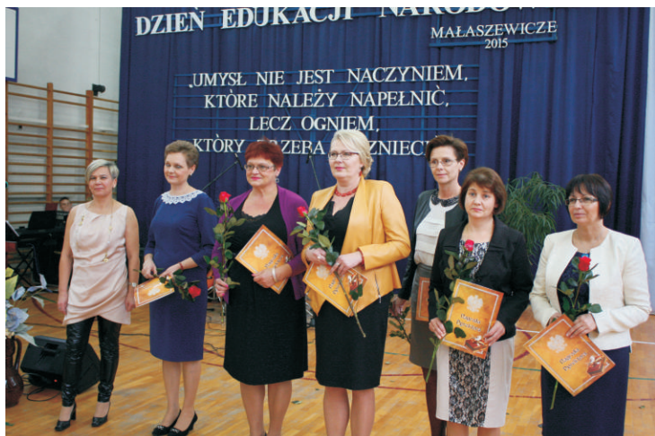
Szkoły Podstawowej im. J. U. Niemcewicza w Neplach